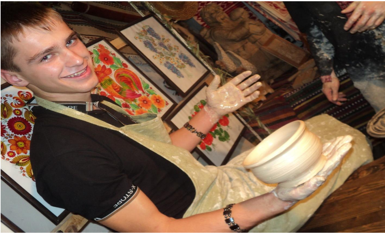
Цікаво спробувати себе в ролі гончара (м.Київ)