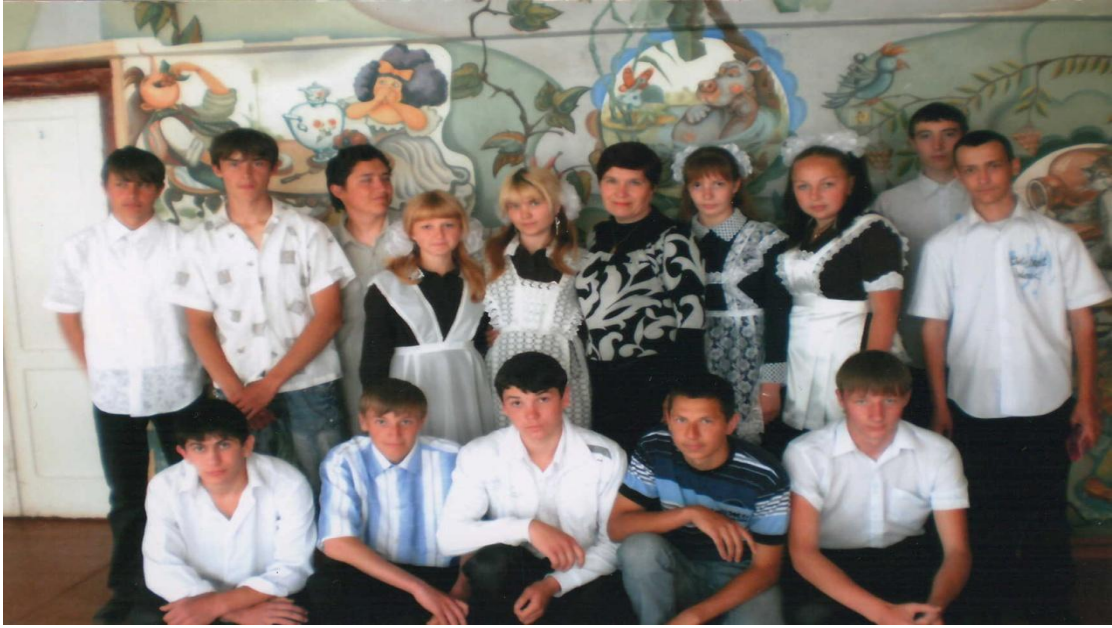
Прощатися завжди важко...