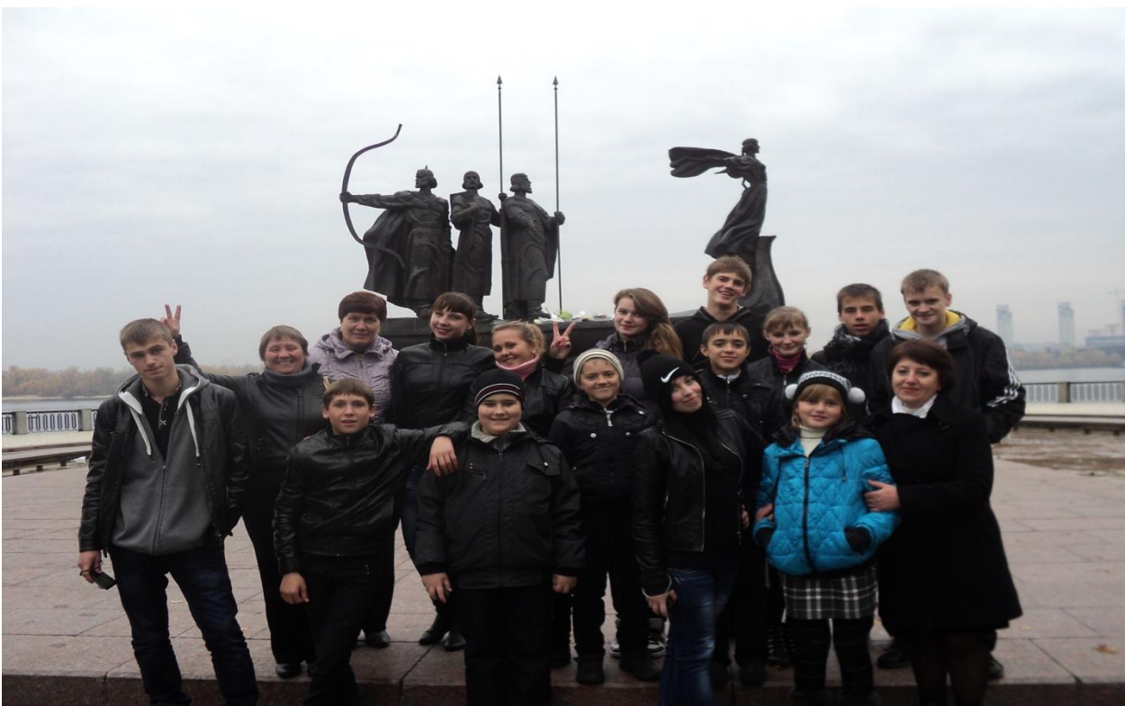
Незабутня поїздка до столиці