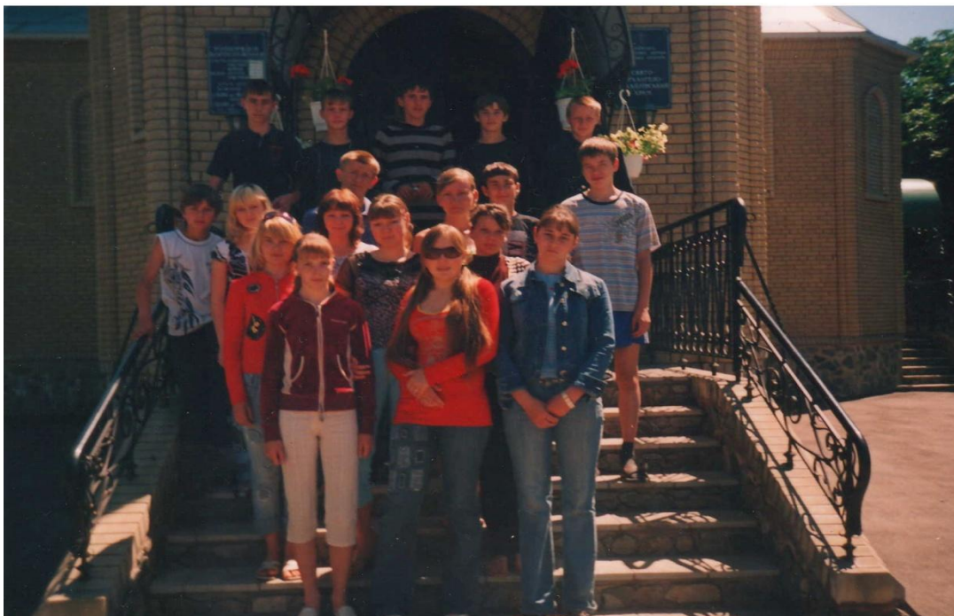
За уроками духовності – до храму.