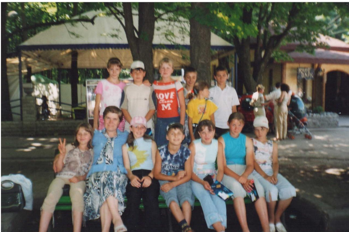
Поїздка до парку відпочинку М.Харків