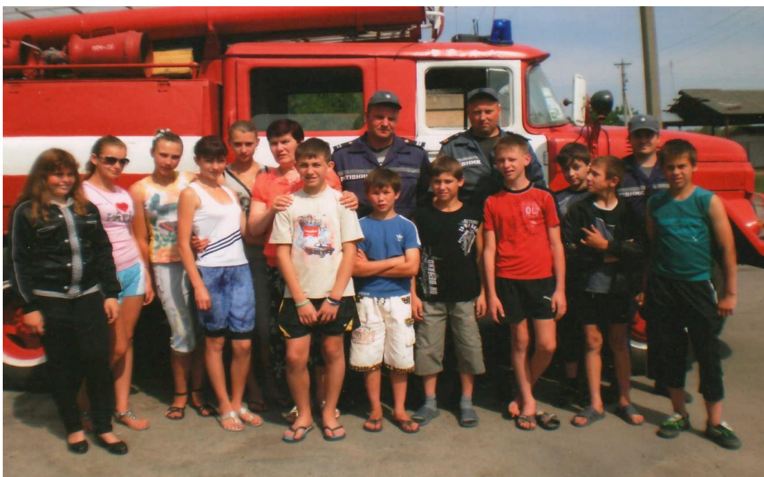
Знайомимося з роботою пожежників