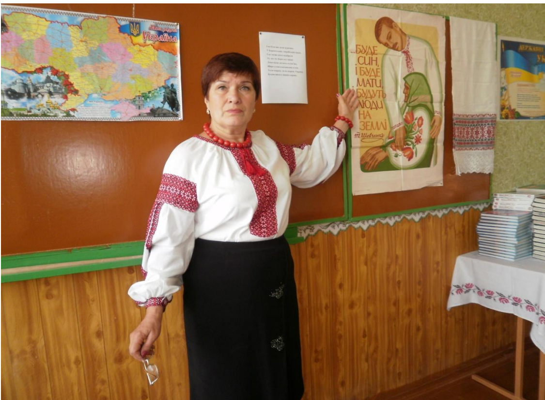
З Україною в серці!