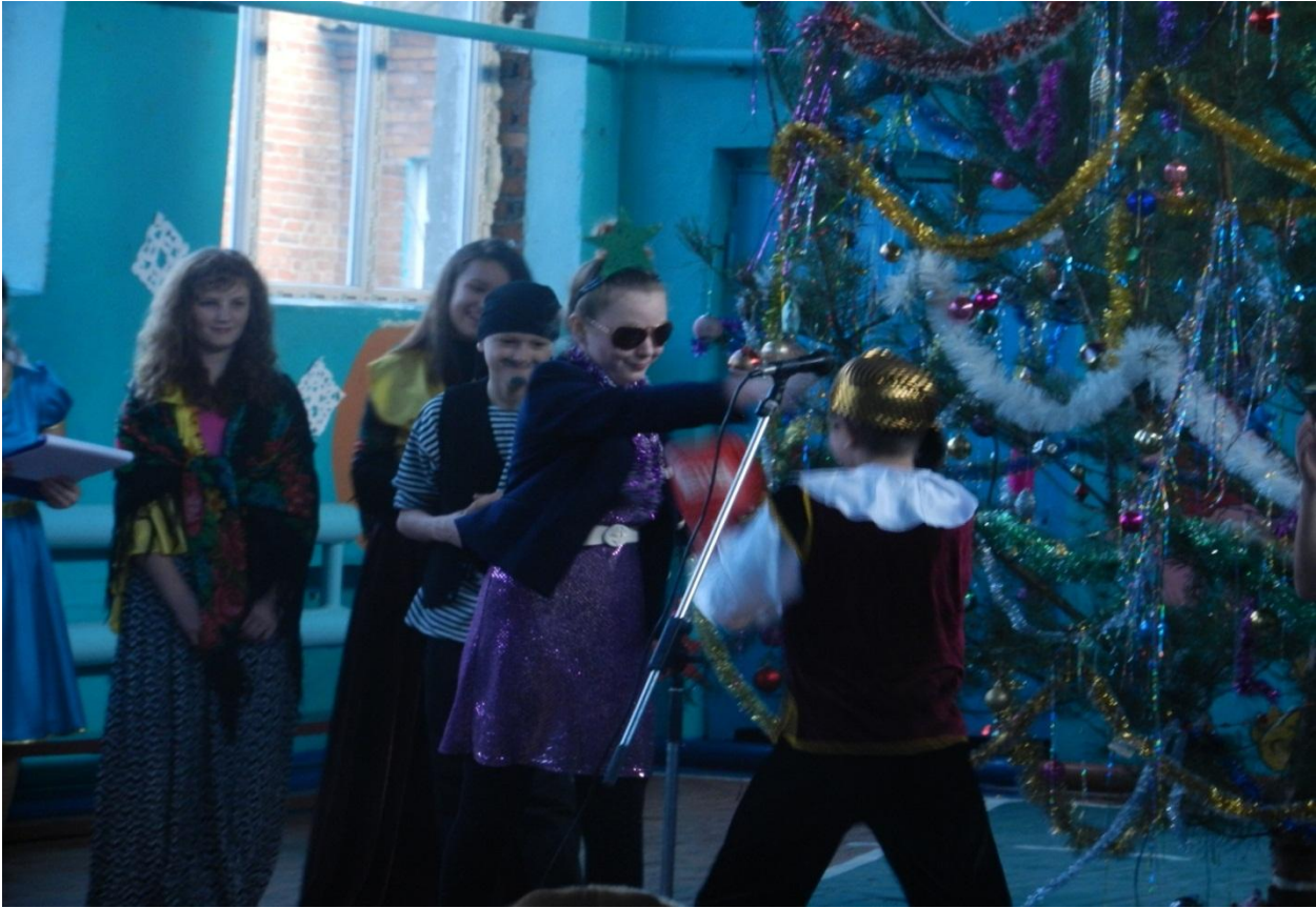
Зустрічаємо Новий рік