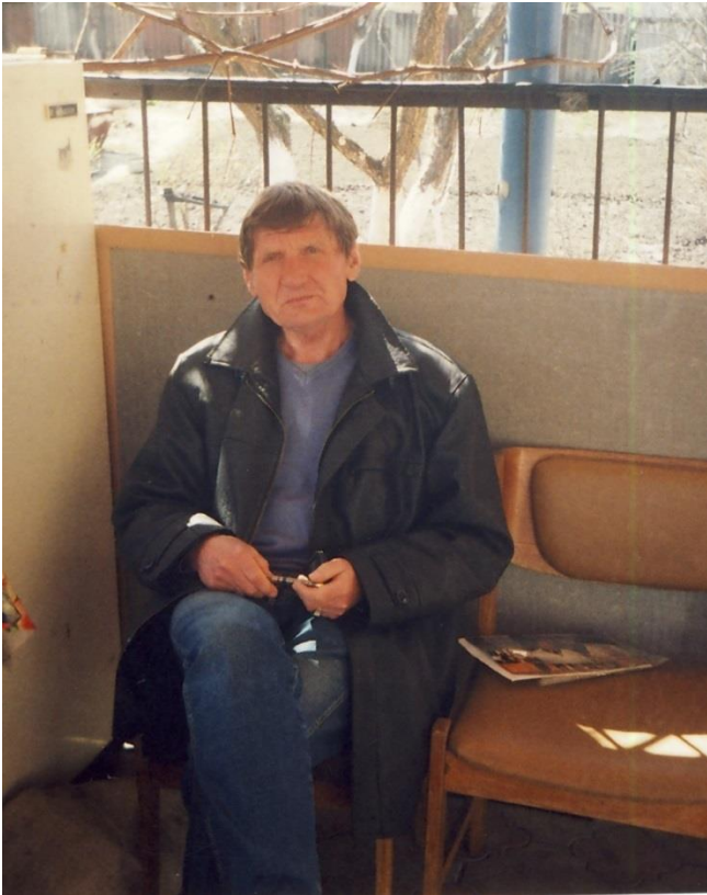
За натхненням на рідну Зачепилівщину