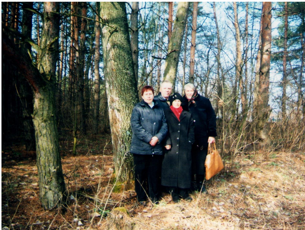
Зустріч з колишніми однокласниками в рідному селі Абазівка