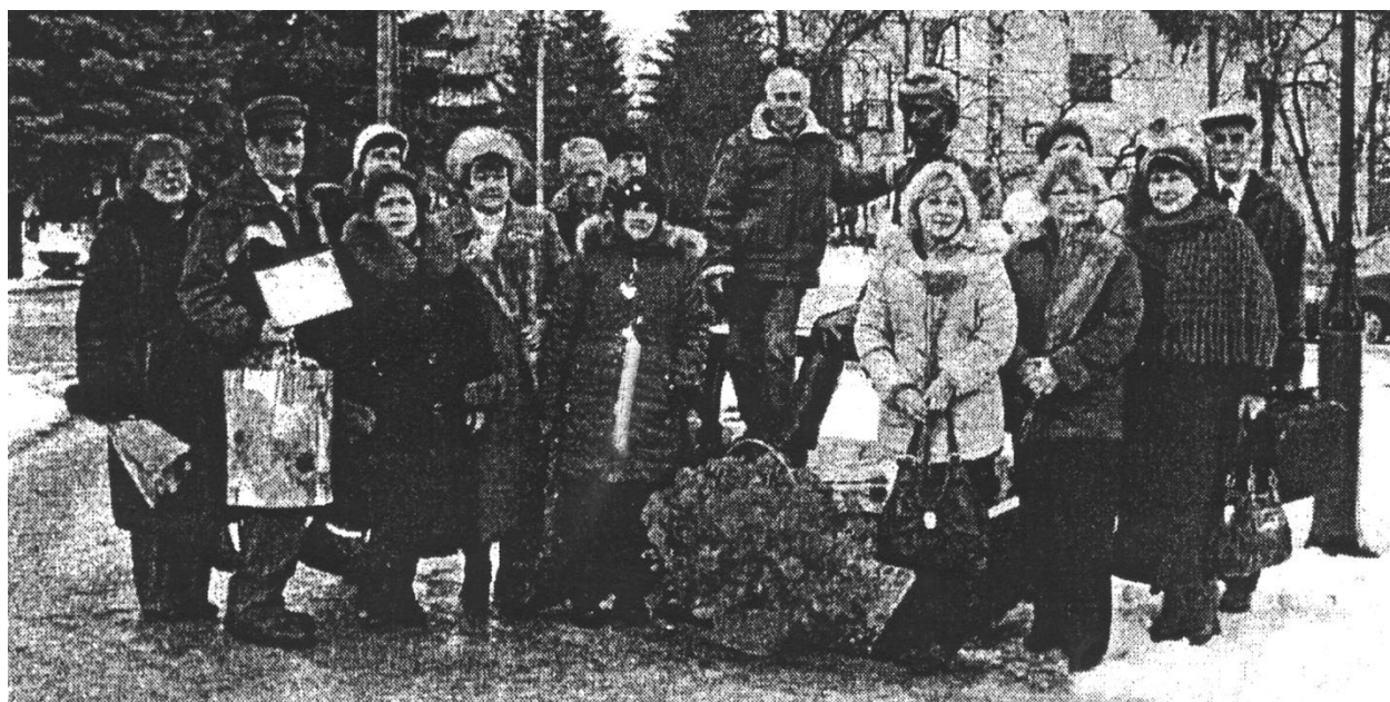
Обмін думками з колегами по перу – джерело натхнення для поетеси